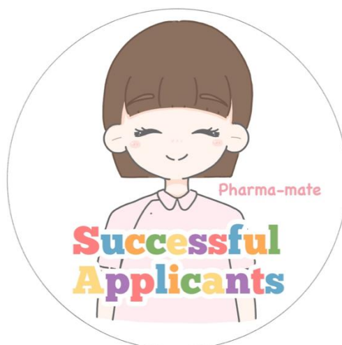
【調剤補助者認定バッジ】