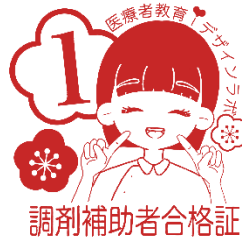
調剤補助者合格証