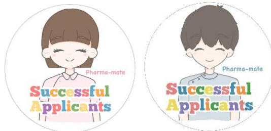
【調剤補助者認定バッジ】