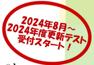
【初年度更新合格証シール】